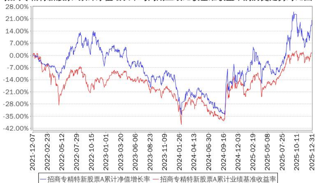
招商专精特新股票A累计净值增长率与同期业绩比较基准收益率的历史走势对比图