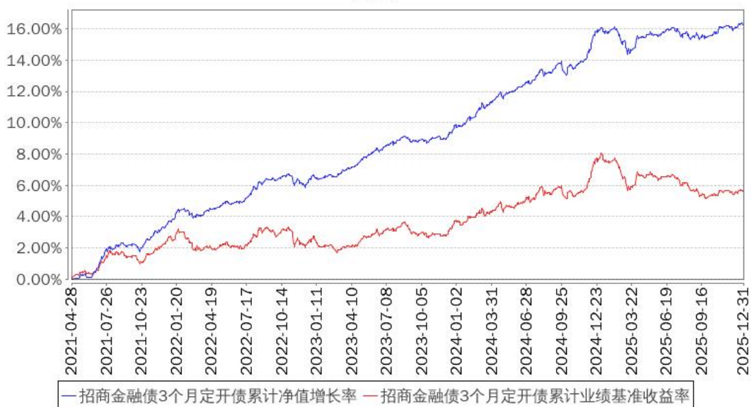
招商金融债3个月定开债累计净值增长率与同期业绩比较基准收益率的历史走势对比图