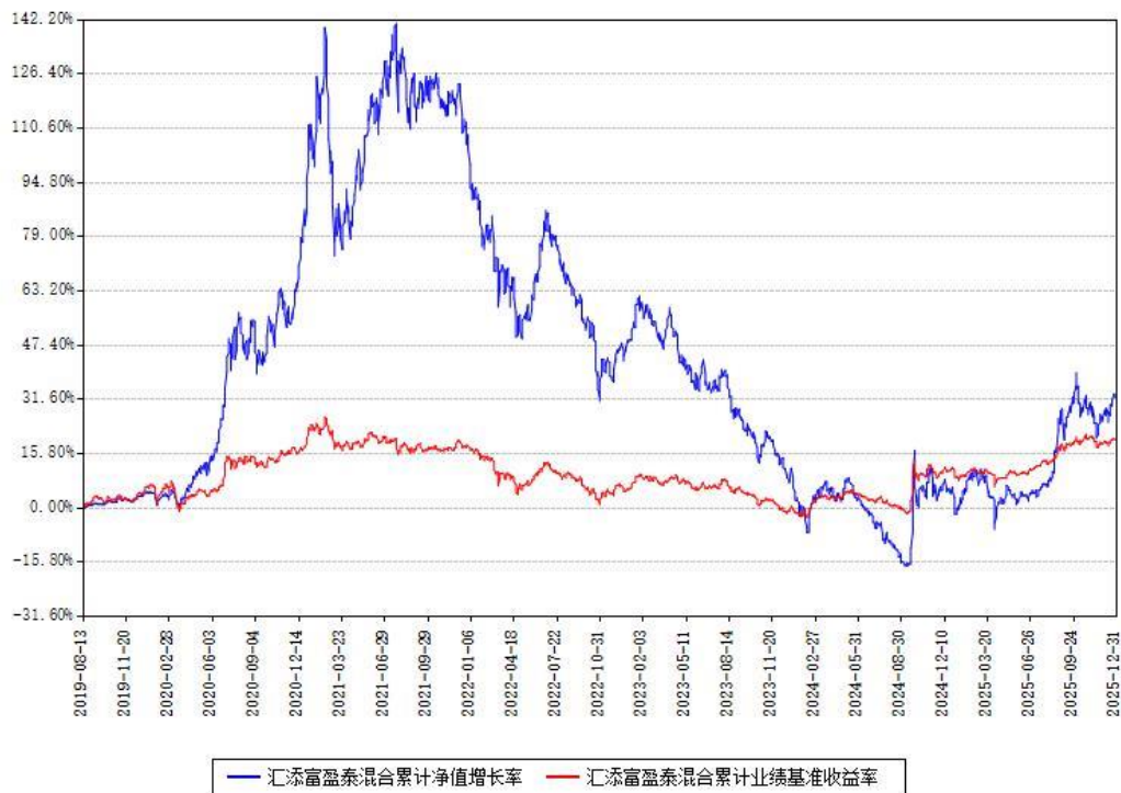
汇添富盈泰混合累计净值增长率与同期业绩基准收益率对比图

注：本基金建仓期为本《基金合同》生效之日（2019年08月13日）起6个月，建仓期结束时各项资产配置比例符合合同约定。