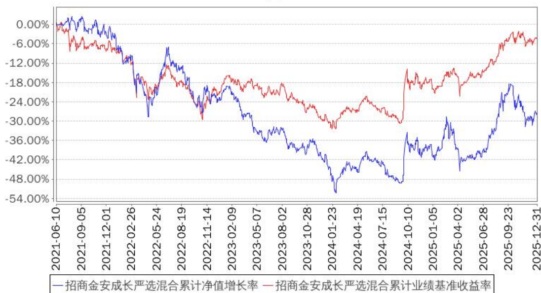
招商金安成长严选混合累计净值增长率与同期业绩比较基准收益率的历史走势对比图