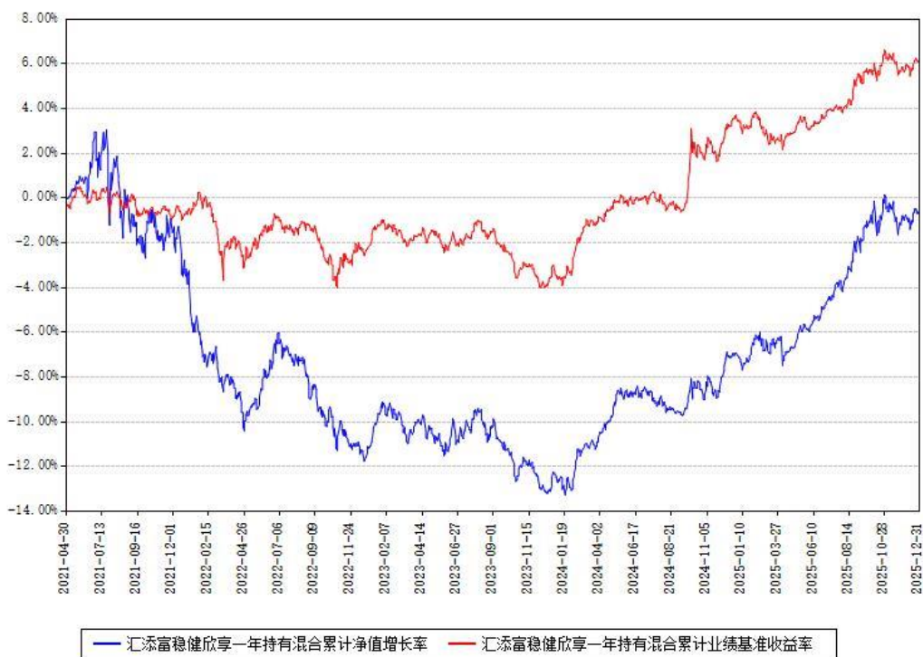
汇添富稳健欣享一年持有混合累计净值增长率与同期业绩基准收益率对比图

注：本基金建仓期为本《基金合同》生效之日（2021年04月30日）起6个月，建仓期结束时各项资产配置比例符合合同约定。