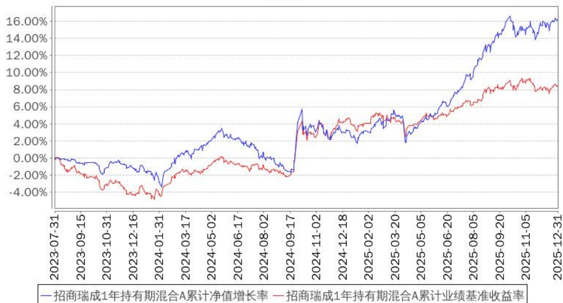
招商瑞成1年持有期混合A累计净值增长率与同期业绩比较基准收益率的历史走势对比图