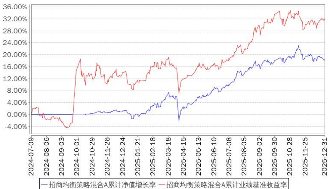
招商均衡策略混合A累计净值增长率与同期业绩比较基准收益率的历史走势对比图