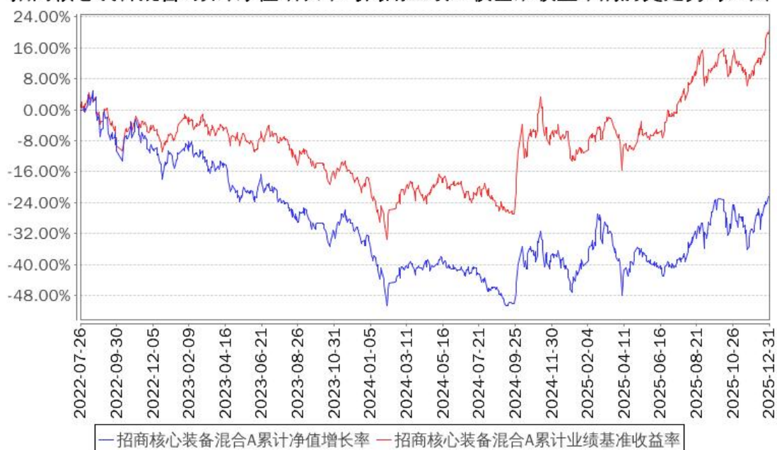
招商核心装备混合A累计净值增长率与同期业绩比较基准收益率的历史走势对比图