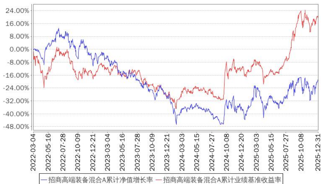
招商高端装备混合A累计净值增长率与同期业绩比较基准收益率的历史走势对比图