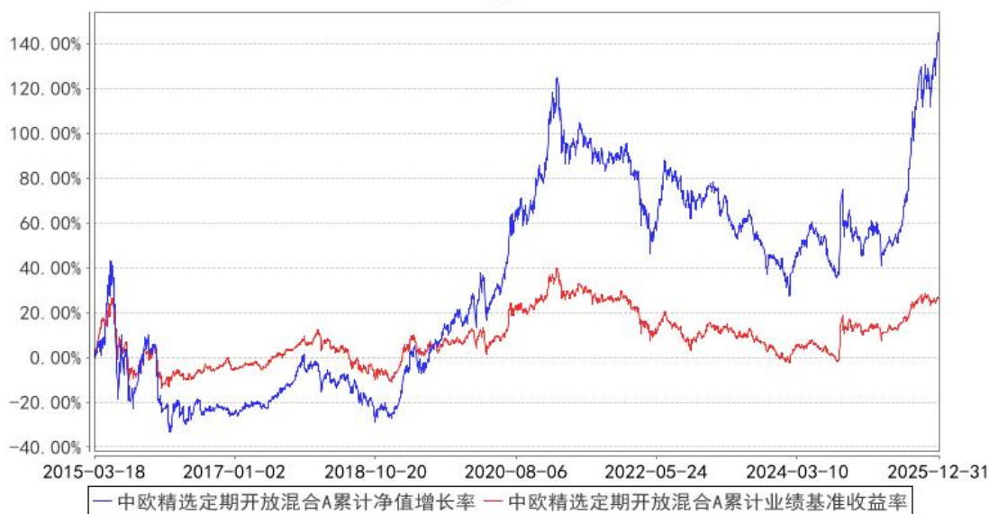
中欧精选定期开放混合A累计净值增长率与同期业绩比较基准收益率的历史走势对比图