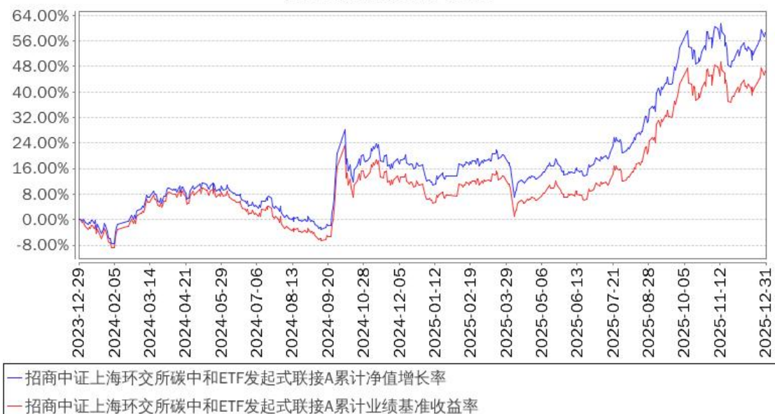
招商中证上海环交所碳中和ETF发起式联接A累计净值增长率与同期业绩比较基准收益率的历史走势对比图