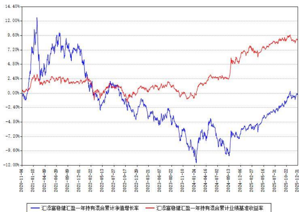
汇添富稳健汇盈一年持有混合累计净值增长率与同期业绩比较基准收益率对比图

注：本基金建仓期为本《基金合同》生效之日（2020年11月04日）起6个月，建仓期结束时各项资产配置比例符合合同约定。