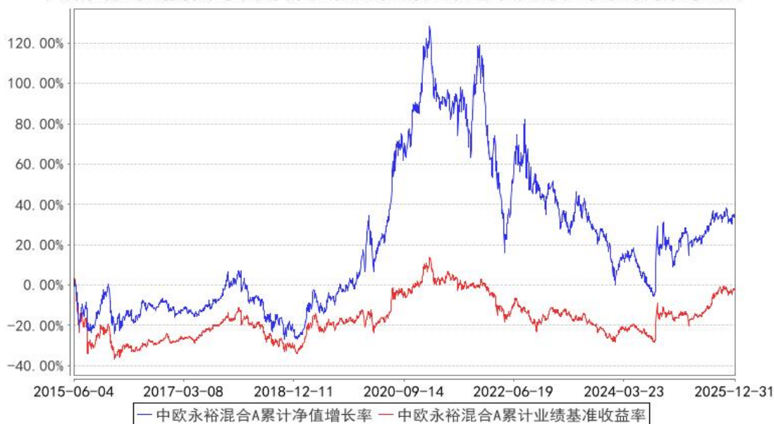
中欧永裕混合A累计净值增长率与同期业绩比较基准收益率的历史走势对比图