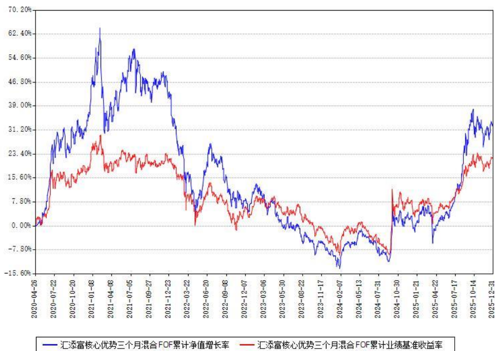
汇添富核心优势三个月混合FOF累计净值增长率与同期业绩基准收益率对比图

注：本基金建仓期为本《基金合同》生效之日（2020年04月26日）起6个月，建仓期结束时各项资产配置比例符合合同约定。