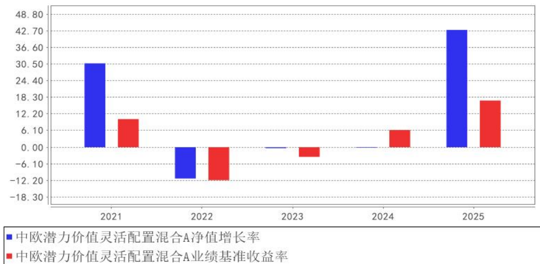
中欧潜力价值灵活配置混合A基金每年净值增长率与同期业绩比较基准收益率的对比图