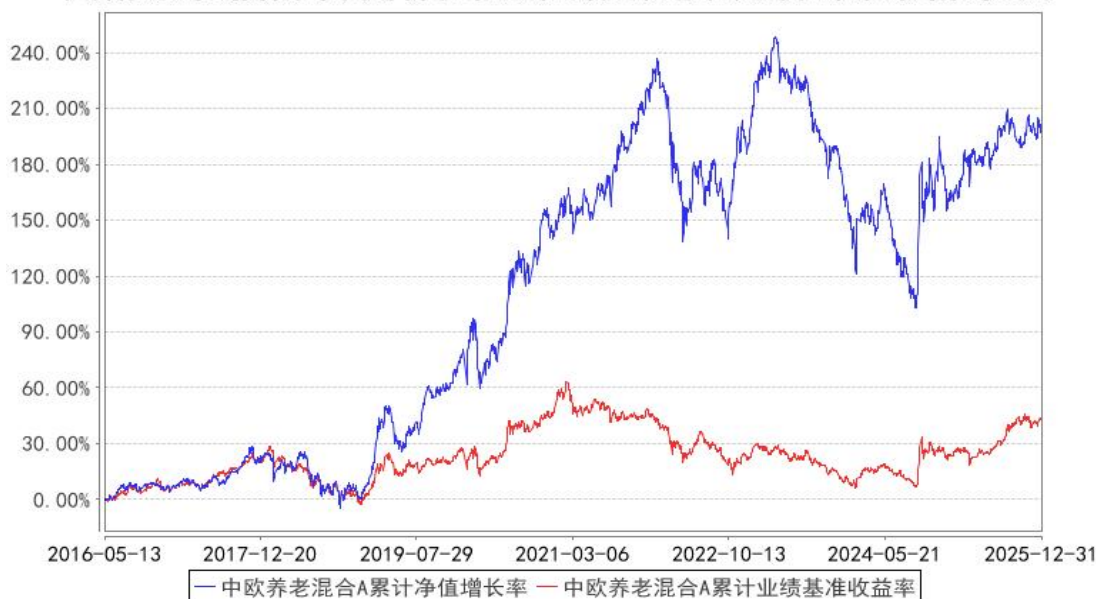
中欧养老混合A累计净值增长率与同期业绩比较基准收益率的历史走势对比图