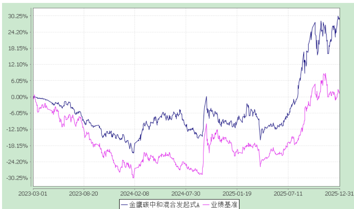
金鹰碳中和混合发起式 C