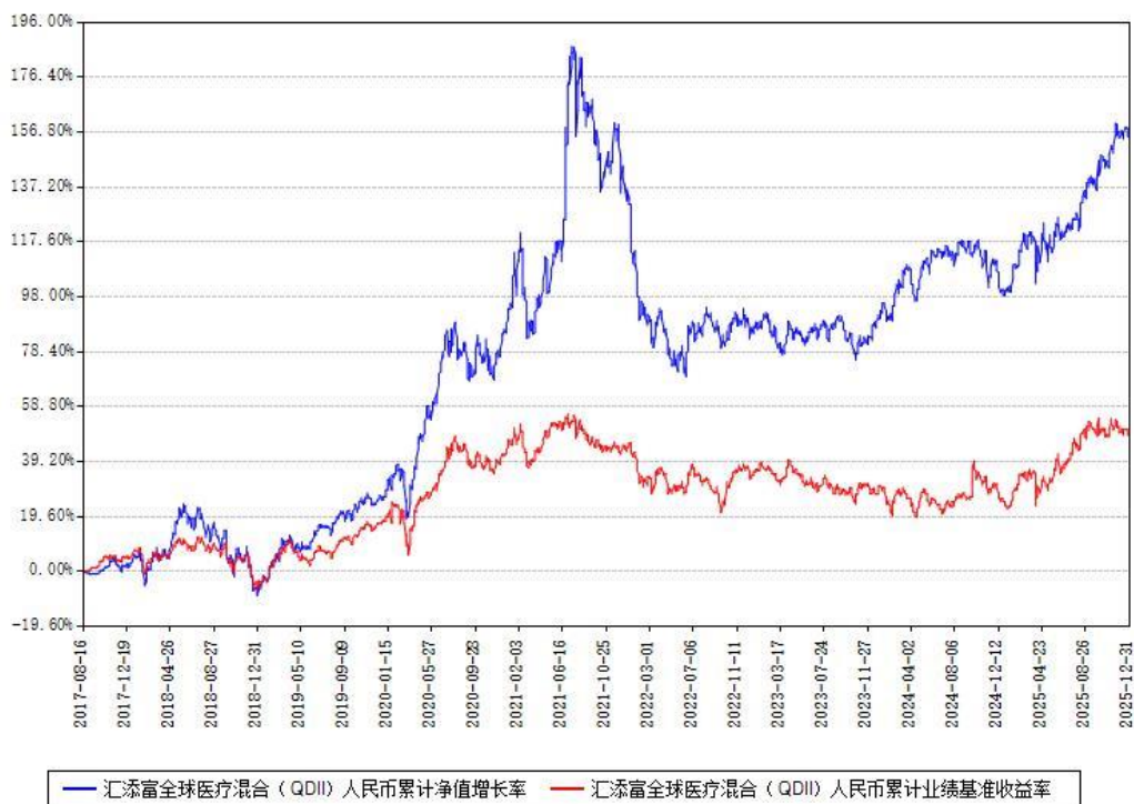
汇添富全球医疗混合（QDII）人民币累计净值增长率与同期业绩比较基准收益率对比图