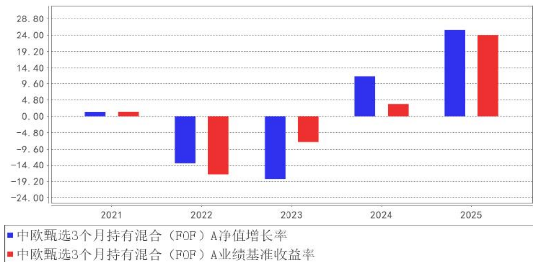
中欧甄选3个月持有混合（FOF）A基金每年净值增长率与同期业绩比较基准收益率的对比图

注：本基金合同生效日为2021年10月28日，2021年度数据为2021年10月28日至2021年12月31日数据。