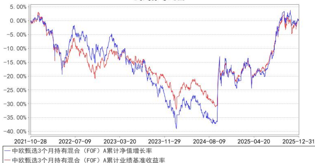
中欧甄选3个月持有混合（FOF）A累计净值增长率与同期业绩比较基准收益率的历史走势对比图

注：2023年5月5日起组合业绩比较基准变更为中证偏股型基金指数收益率×80%+银行活期存款利率(税后)×20%。