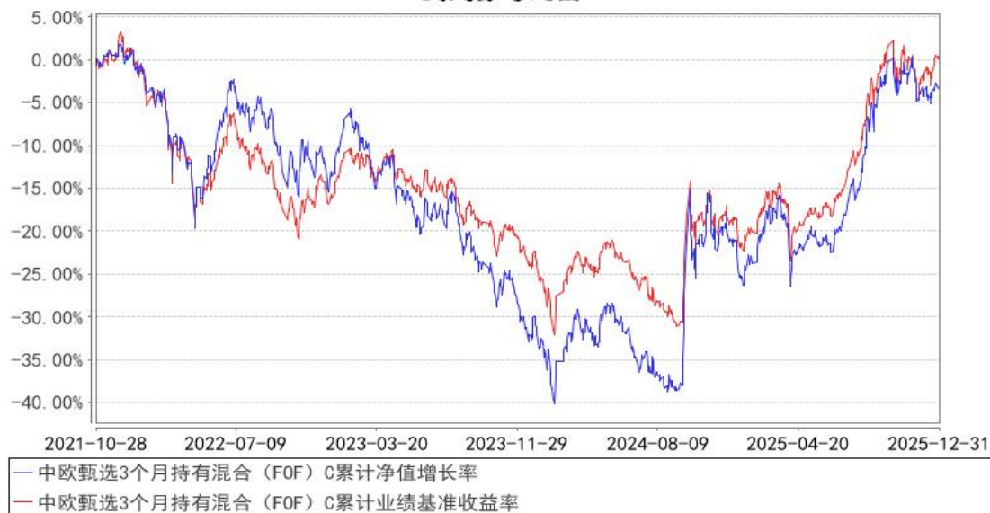
中欧甄选3个月持有混合（FOF）C累计净值增长率与同期业绩比较基准收益率的历史走势对比图

注：2023年5月5日起组合业绩比较基准变更为中证偏股型基金指数收益率×80%+银行活期存款利率(税后)×20%。