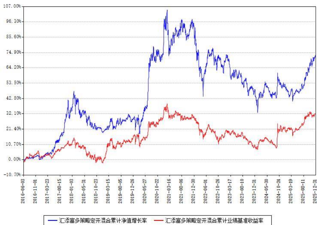
汇添富多策略定开混合累计净值增长率与同期业绩基准收益率对比图

注：本基金建仓期为本《基金合同》生效之日（2016年06月03日）起6个月，建仓期结束时各项资产配置比例符合合同约定。