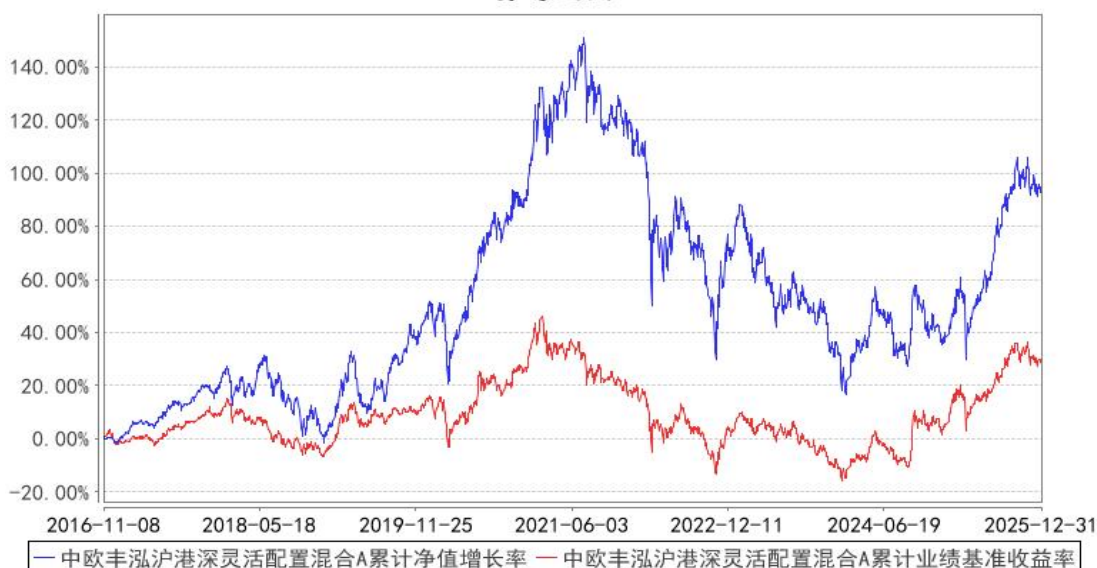
中欧丰泓沪港深灵活配置混合A累计净值增长率与同期业绩比较基准收益率的历史走势对比图