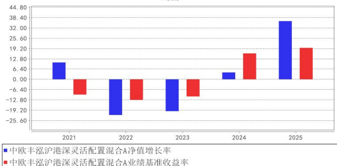
中欧丰泓沪港深灵活配置混合A基金每年净值增长率与同期业绩比较基准收益率的对比图