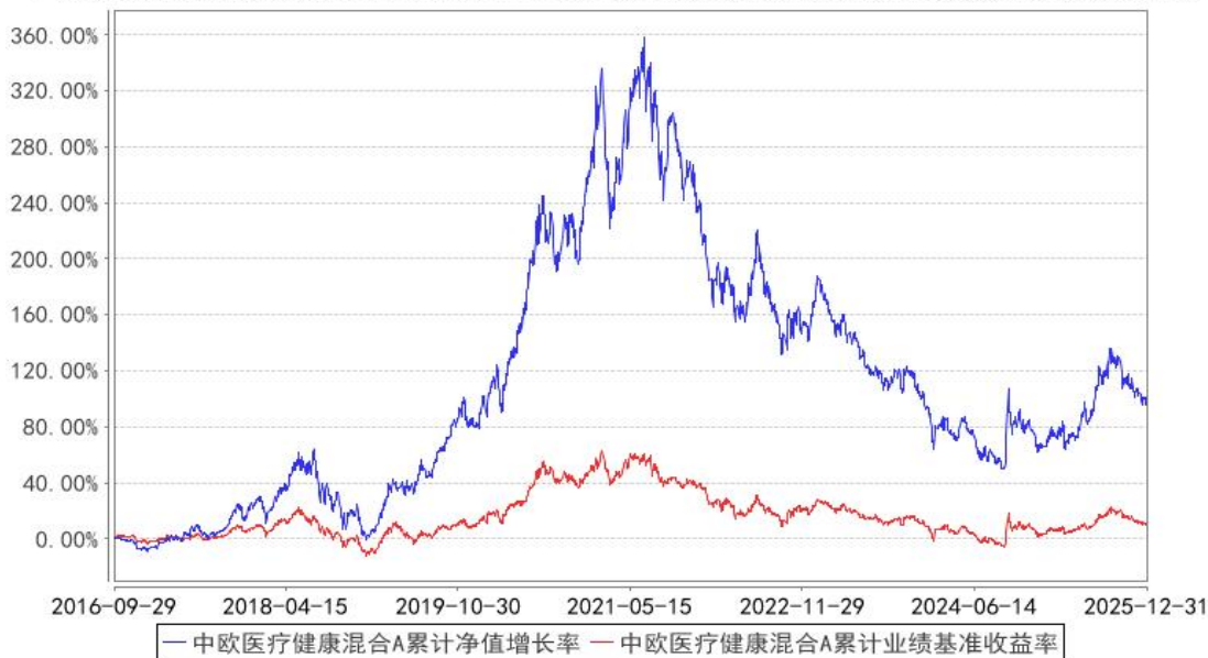
中欧医疗健康混合A累计净值增长率与同期业绩比较基准收益率的历史走势对比图