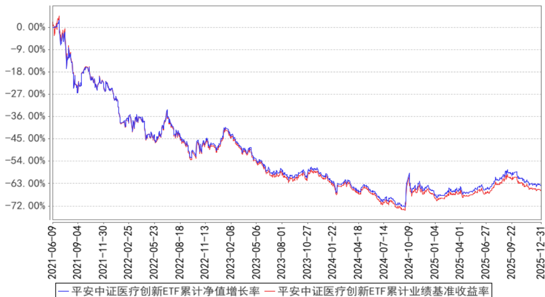
平安中证医疗创新ETF累计净值增长率与同期业绩比较基准收益率的历史走势对比图