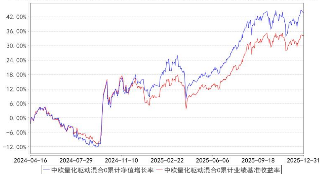
中欧量化驱动混合C累计净值增长率与同期业绩比较基准收益率的历史走势对比图

注：本基金于 2024 年 4 月 1 日新增 C 类份额，图示日期为 2024 年 4 月 16 日至 2025 年 12 月 31 日。