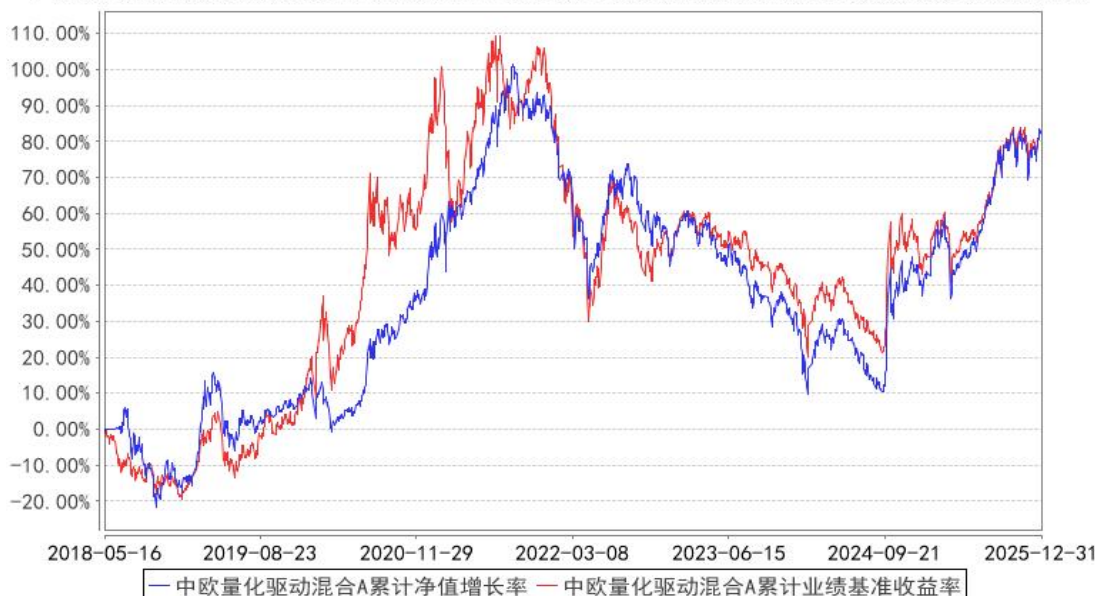
中欧量化驱动混合A累计净值增长率与同期业绩比较基准收益率的历史走势对比图

注：2019年4月26日，组合业绩比较基准变更为创业板指数收益率*95%+中债综合指数收益率*5%。2022年8月11日，业绩比较基准变更为中证全指指数收益率*80%+银行活期存款利率(税后)*15%+