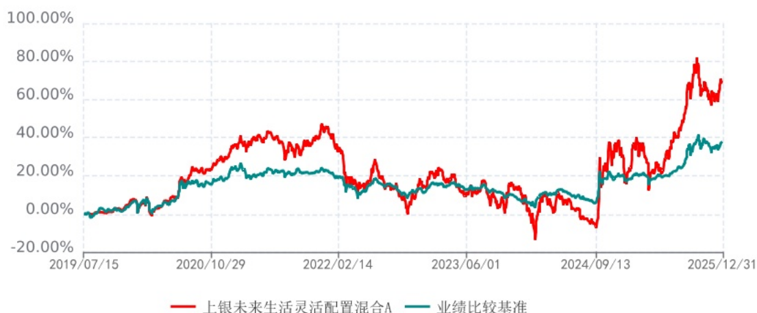
上银未来生活灵活配置混合C累计净值增长率与业绩比较基准收益率历史走势对比图