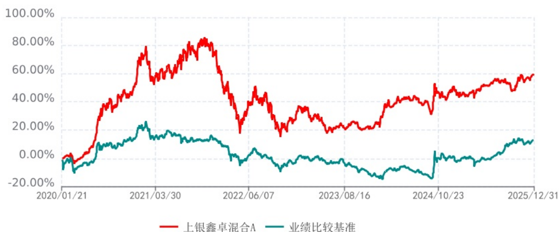
上银鑫卓混合C累计净值增长率与业绩比较基准收益率历史走势对比图