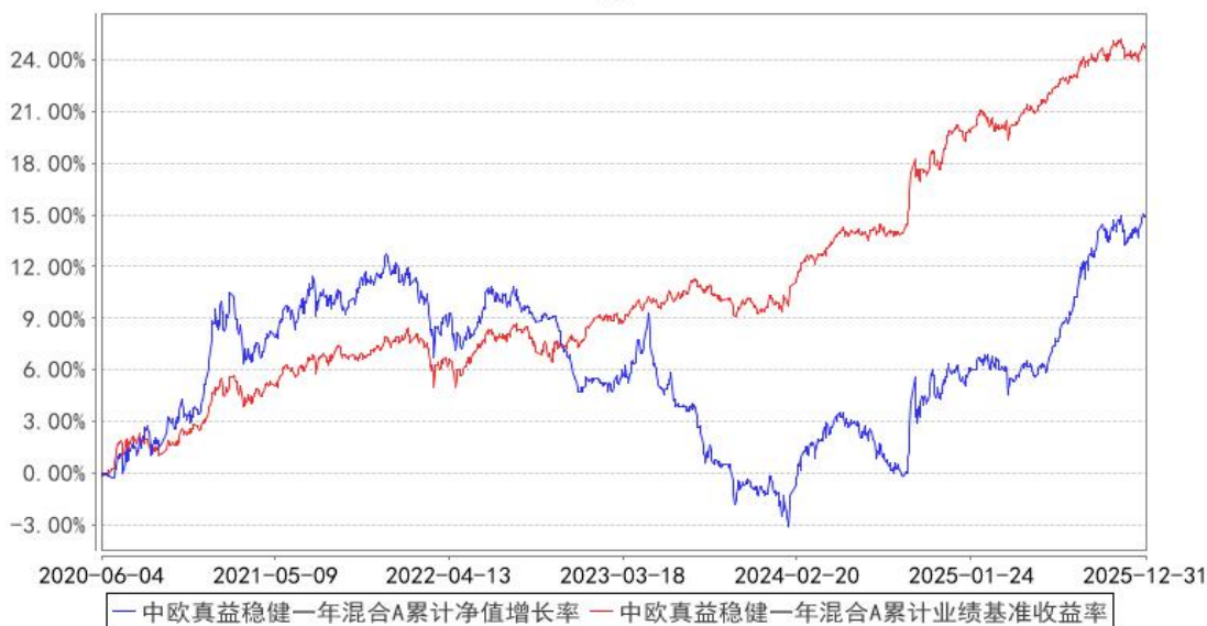
中欧真益稳健一年混合A累计净值增长率与同期业绩比较基准收益率的历史走势对比图