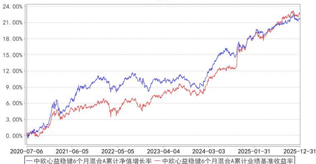
中欧心益稳健6个月混合A累计净值增长率与同期业绩比较基准收益率的历史走势对比图