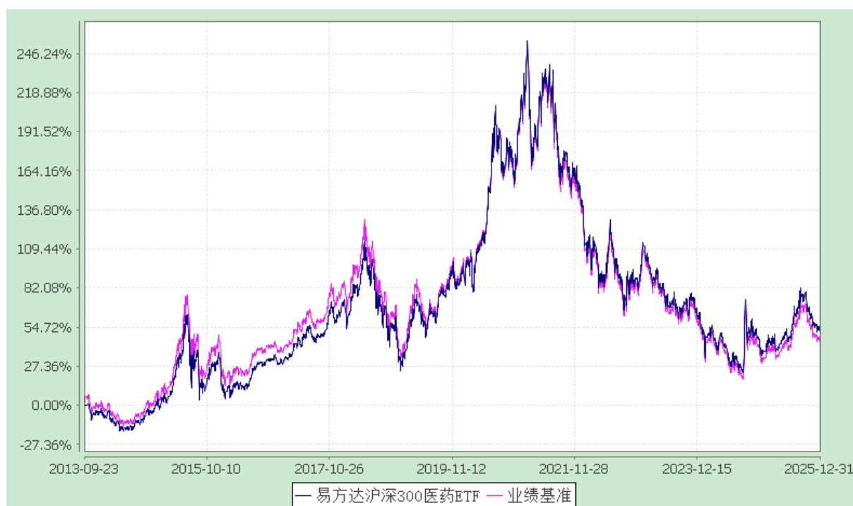
易方达沪深 300 医药卫生交易型开放式指数证券投资基金 份额累计净值增长率与业绩比较基准收益率历史走势对比图 (2013 年 9 月 23 日至 2025 年 12 月 31 日)