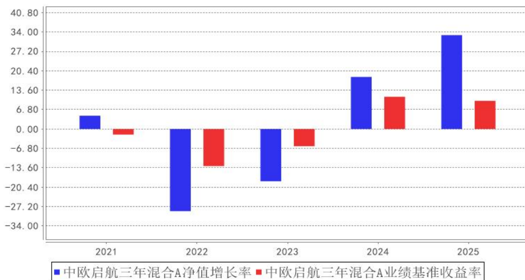
中欧启航三年混合A基金每年净值增长率与同期业绩比较基准收益率的对比图