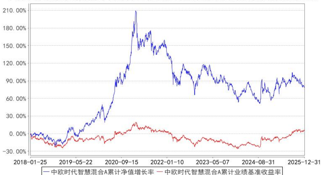
中欧时代智慧混合A累计净值增长率与同期业绩比较基准收益率的历史走势对比图