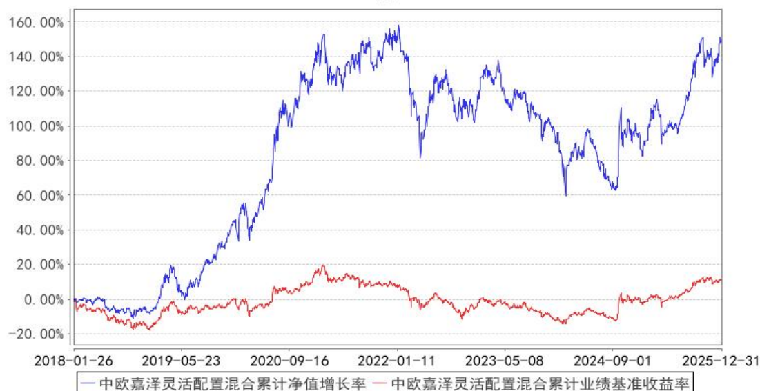
中欧嘉泽灵活配置混合累计净值增长率与同期业绩比较基准收益率的历史走势对比图