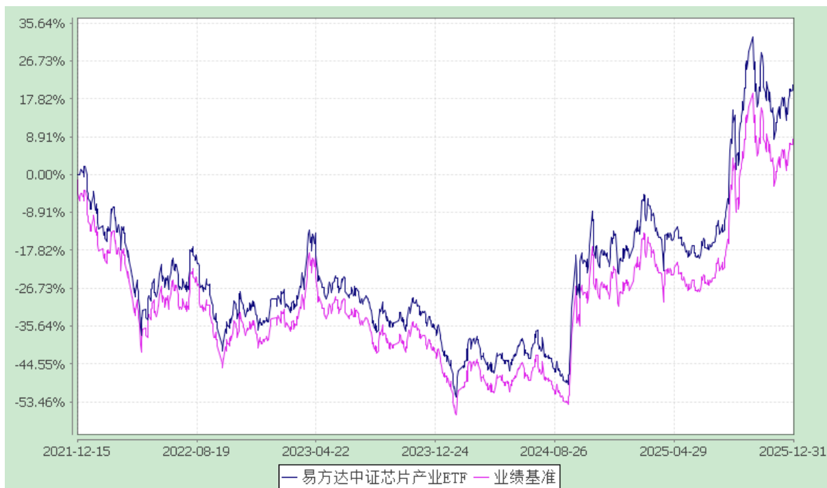
易方达中证芯片产业交易型开放式指数证券投资基金 份额累计净值增长率与业绩比较基准收益率历史走势对比图 (2021 年 12 月 15 日至 2025 年 12 月 31 日)