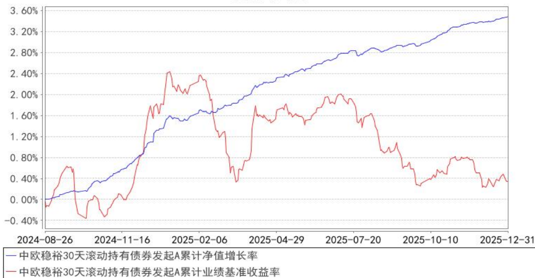
中欧稳裕30天滚动持有债券发起A累计净值增长率与同期业绩比较基准收益率的历史走势对比图

注：本基金基金合同生效日期为 2024 年 8 月 26 日，按基金合同的规定，本基金自基金合同生效起六个月为建仓期，建仓期结束时各项资产配置比例已经符合基金合同约定。