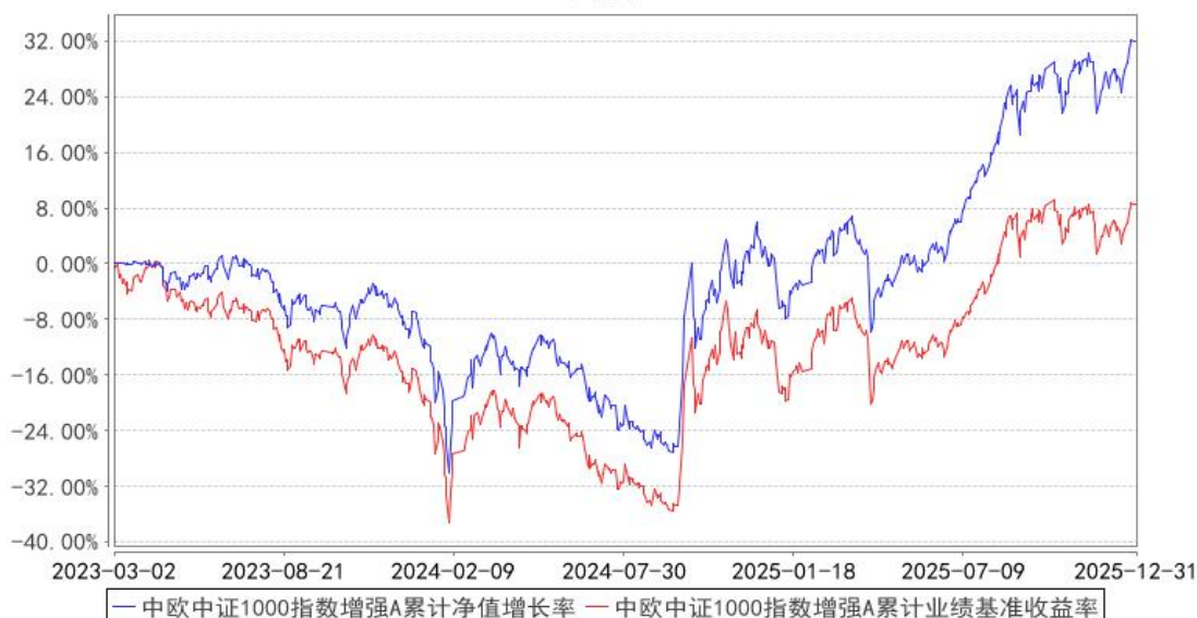
中欧中证1000指数增强A累计净值增长率与同期业绩比较基准收益率的历史走势对比图