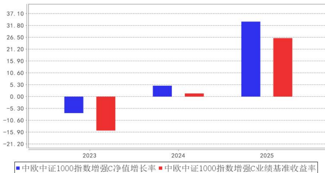
中欧中证1000指数增强C基金每年净值增长率与同期业绩比较基准收益率的对比图

注：本基金合同生效日为 2023 年 3 月 2 日，2023 年度数据为 2023 年 3 月 2 日至 2023 年 12 月 31 日数据。