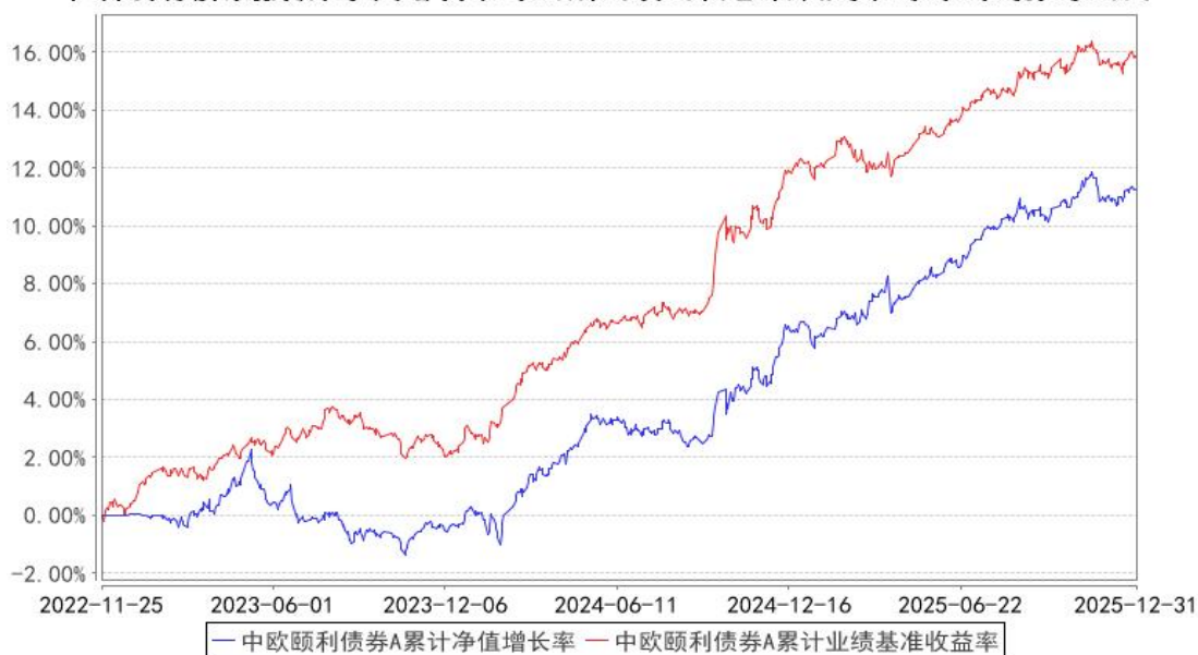
中欧颐利债券A累计净值增长率与同期业绩比较基准收益率的历史走势对比图