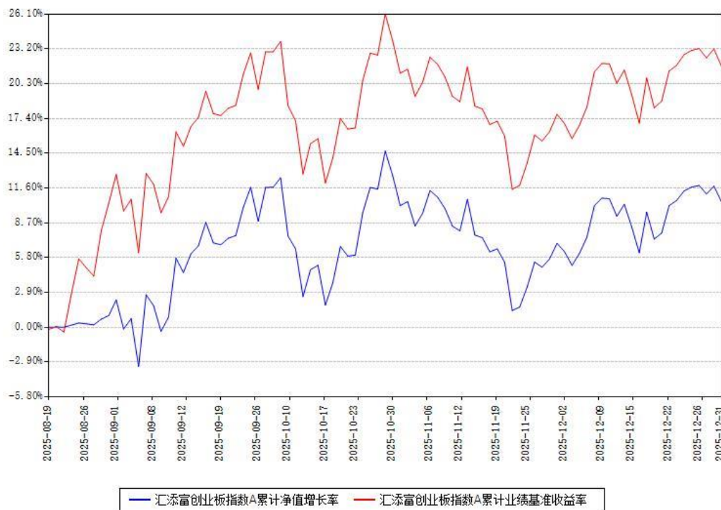
汇添富创业板指数A累计净值增长率与同期业绩基准收益率对比图