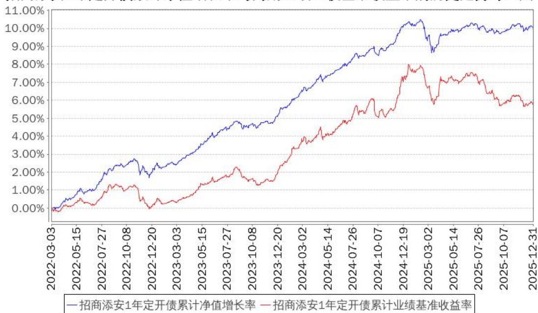
招商添安1年定开债累计净值增长率与同期业绩比较基准收益率的历史走势对比图