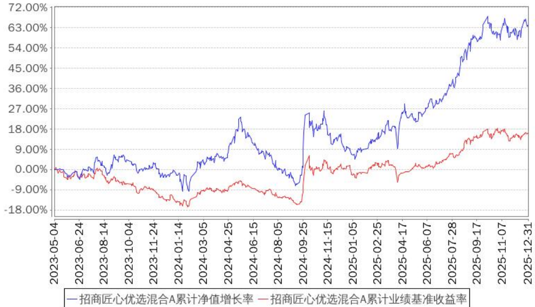
招商匠心优选混合A累计净值增长率与同期业绩比较基准收益率的历史走势对比图