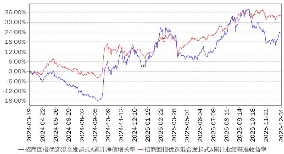
招商回报优选混合发起式A累计净值增长率与同期业绩比较基准收益率的历史走势对比图