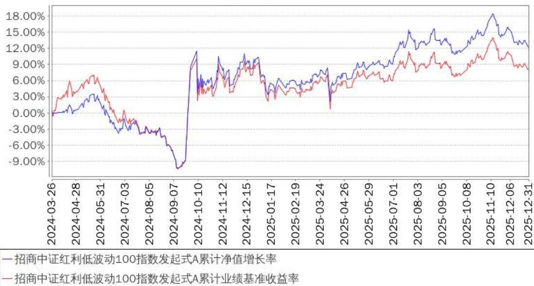
招商中证红利低波动100指数发起式A累计净值增长率与同期业绩比较基准收益率的历史走势对比图