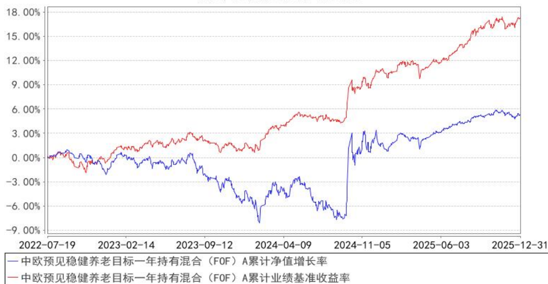
中欧预见稳健养老目标一年持有混合（FOF）A 累计净值增长率与同期业绩比较基准收益率的历史走势对比图

注：2025 年 1 月 27 日起组合业绩比较基准变更为中证债券型基金指数收益率*80%+中证 800 指数收益率*15%+中证港股通综合指数(人民币)收益率*3%+中证商品期货成份指数收益率*2%。