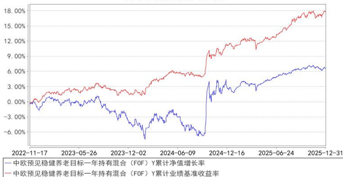
中欧预见稳健养老目标一年持有混合（FOF）Y 累计净值增长率与同期业绩比较基准收益率的历史走势对比图

注：2025 年 1 月 27 日起组合业绩比较基准变更为中证债券型基金指数收益率*80%+中证 800 指数收益率*15%+中证港股通综合指数(人民币)收益率*3%+中证商品期货成份指数收益率*2%。本基金于 2022 年 11 月 11 日新增 Y 类份额，图示日期为 2022 年 11 月 17 日至 2025 年 12 月 31 日。