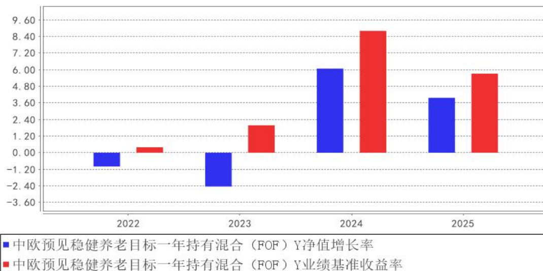
中欧预见稳健养老目标一年持有混合（FOF）Y基金每年净值增长率与同期业绩比较基准收益率的对比图

注：2022 年 11 月 11 日本基金新增 Y 份额，2022 年度数据为 2022 年 11 月 17 日至 2022 年 12 月 31 日数据。