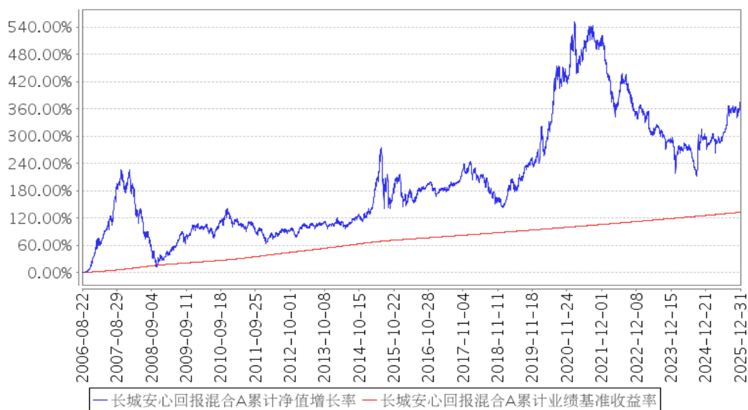
长城安心回报混合A累计净值增长率与同期业绩比较基准收益率的历史走势对比图