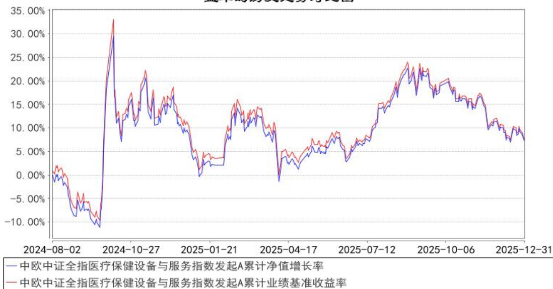
中欧中证全指医疗保健设备与服务指数发起A累计净值增长率与同期业绩比较基准收益率的历史走势对比图

注：本基金基金合同生效日期为 2024 年 8 月 2 日，按基金合同的规定，本基金自基金合同生效起六个月为建仓期，建仓期结束时各项资产配置比例已经符合基金合同约定。