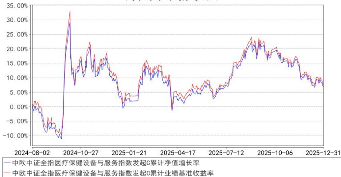
中欧中证全指医疗保健设备与服务指数发起C累计净值增长率与同期业绩比较基准收益率的历史走势对比图

注：本基金基金合同生效日期为 2024 年 8 月 2 日，按基金合同的规定，本基金自基金合同生效起六个月为建仓期，建仓期结束时各项资产配置比例已经符合基金合同约定。