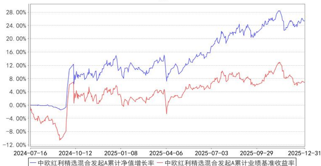
中欧红利精选混合发起A累计净值增长率与同期业绩比较基准收益率的历史走势对比图

注：本基金基金合同生效日期为 2024 年 7 月 16 日，按基金合同的规定，本基金自基金合同生效起六个月为建仓期，建仓期结束时各项资产配置比例已经符合基金合同约定。