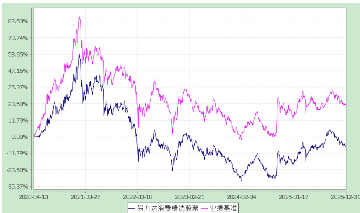
易方达消费精选股票型证券投资基金 份额累计净值增长率与业绩比较基准收益率历史走势对比图 (2020 年 4 月 13 日至 2025 年 12 月 31 日)