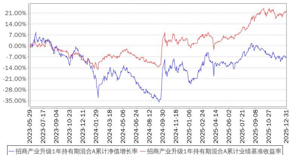
招商产业升级1年持有期混合A累计净值增长率与同期业绩比较基准收益率的历史走势对比图