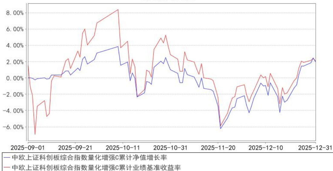
中欧上证科创板综合指数量化增强C累计净值增长率与同期业绩比较基准收益率的历史走势对比图

注：本基金基金合同生效日期为 2025 年 9 月 1 日，自基金合同生效日起到本报告期末不满一年，按基金合同的规定，本基金自基金合同生效起六个月为建仓期，建仓期结束时各项资产配置比例应当符合基金合同约定。