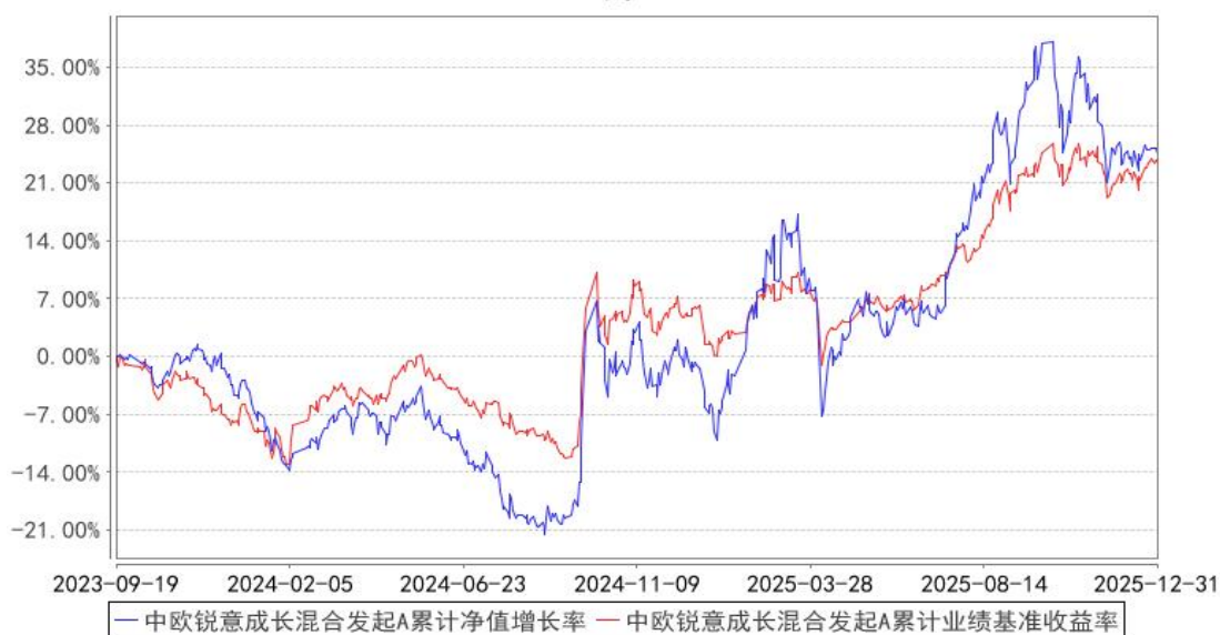
中欧锐意成长混合发起A累计净值增长率与同期业绩比较基准收益率的历史走势对比图