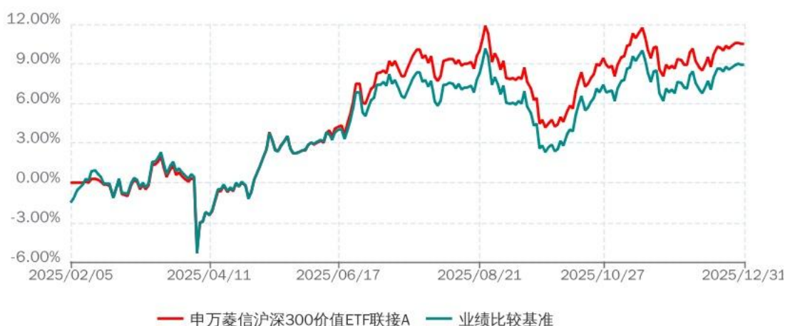
申万菱信沪深300价值ETF联接C累计净值增长率与业绩比较基准收益率历史走势对比图